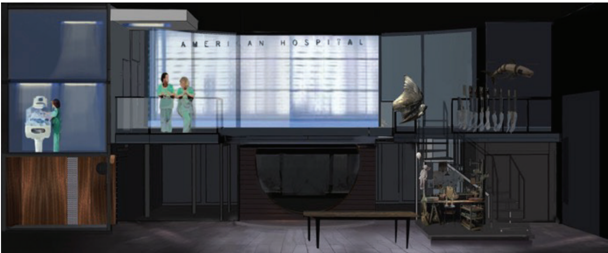
Maquettes de la scénographie © Emmanuelle Roy